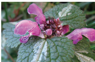
Mrtva kopriva ( Lamium spp. )