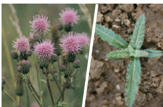
Navadni osat ( Cirsium arvensis )