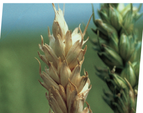
Fuzarioze klasa ( Fusarium spp., Microdochium nivale )