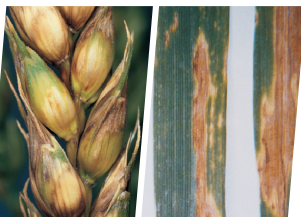
Rjavenje pšeničnih plev ( Stagnospora/Septoria nodorum )