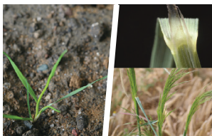
Navadni srakoprec ( Apera spica-venti )