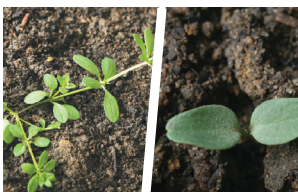
Plezajoča lakota ( Galium aparine )